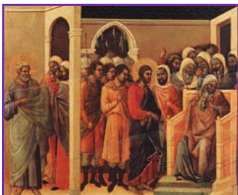
Iisus în fața lui Caiafa, de Duccio da Boninsegna