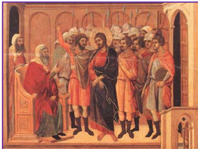
Iisus în fața lui Anna, de Duccio da Boninsegna

Mântuitorul Iisus Hristos este cea mai flagrantă victimă a sistemului judiciar din toate timpurile. A fost condamnat la moarte fără drept de apel, de judecători care au jucat și rolul de avocați, și de martori. Iisus Hristos a avut parte de două procese: unul după legea iudaică și altul după legea romană. Simpla lectură a celor patru Evanghelii, după Matei, Marcu, Luca și Ioan, ne oferă imaginea unei mari nedreptăți.