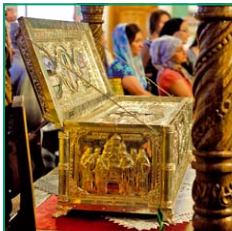
Racla Sf. Paisie