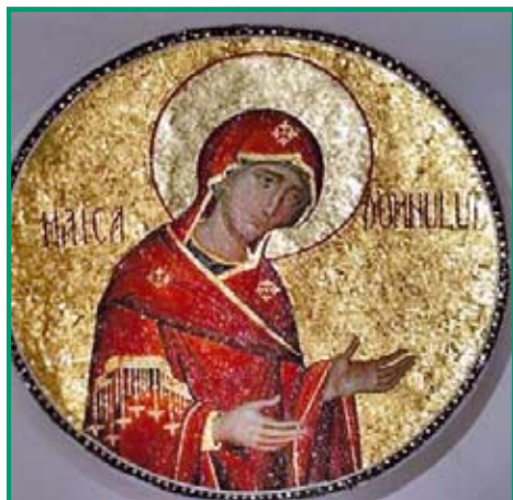
Mozaic Maica Domnului