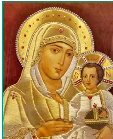
Icoana Maicii Domnului Ierusalimita din Biserica Șerban Vodă