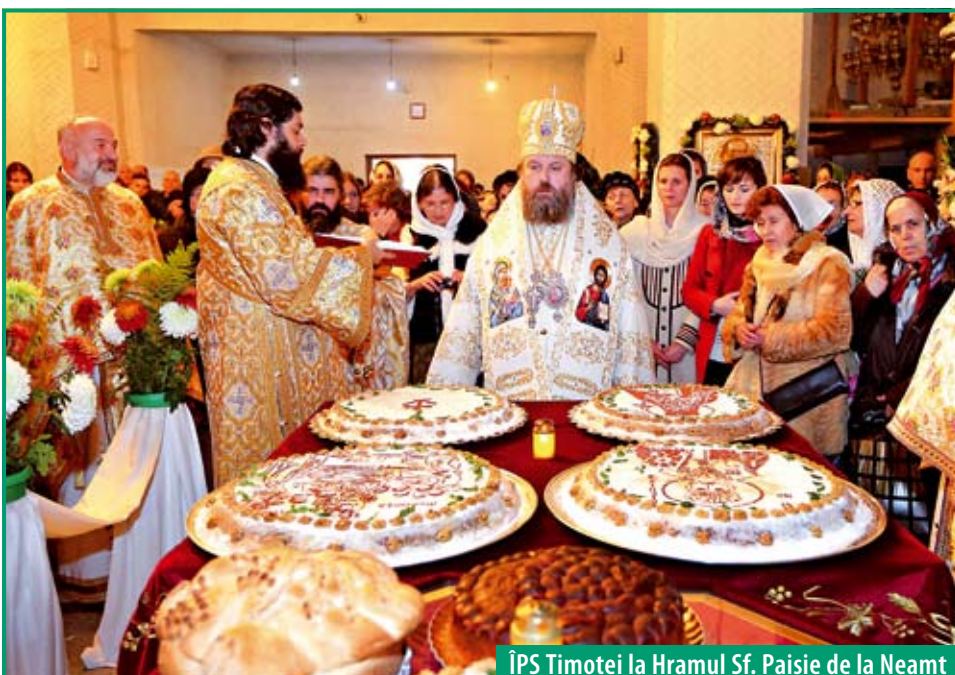
ÎPS Timotei la Hramul Sf. Paisie de la Neamț