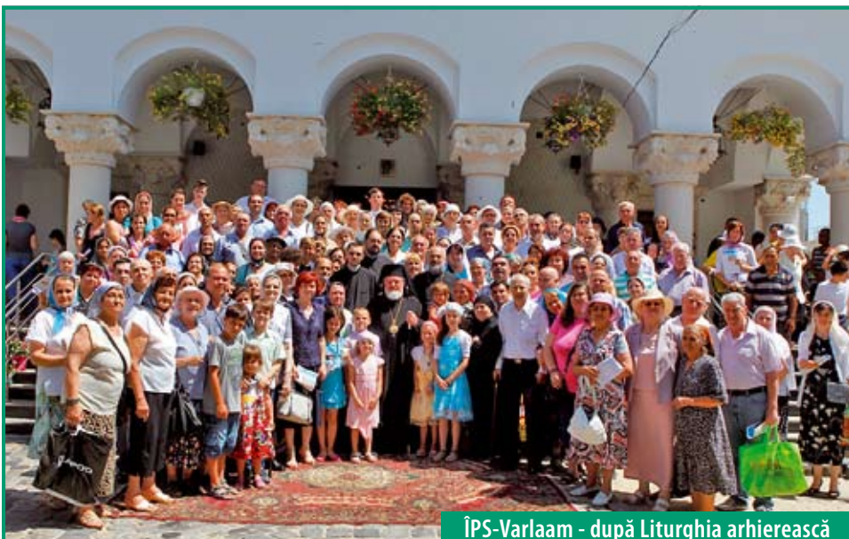
ÎPS-Varlaam - după Liturghia arhierască